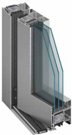
drzwi MB-104 Passive SI