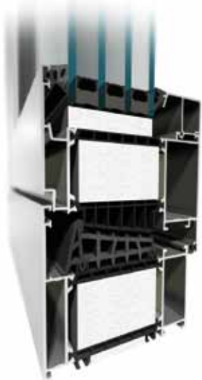
MB-104 Passive Aero