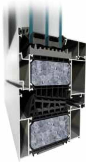
MB-104 Passive SI